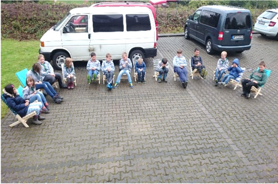
Stühle bauen beim Pfadfinderevent