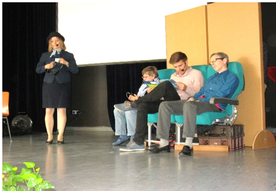
Anspiel beim Gemeinschaftstag in Pfungstadt